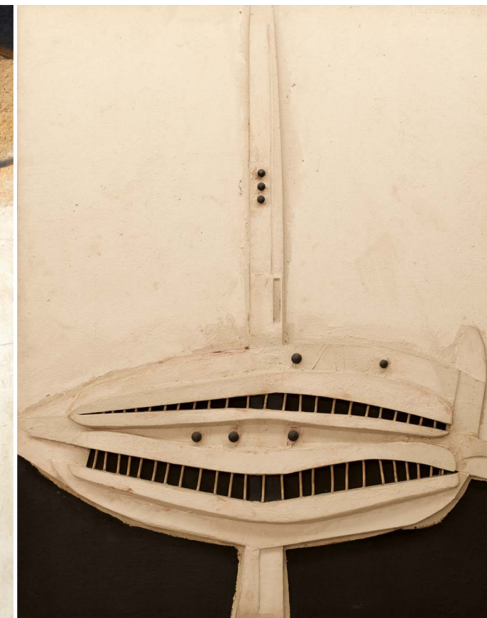
Jaap Wagemaker, Dognun mur , 1964, gemengde techniek op jute en hout, 150x130cm