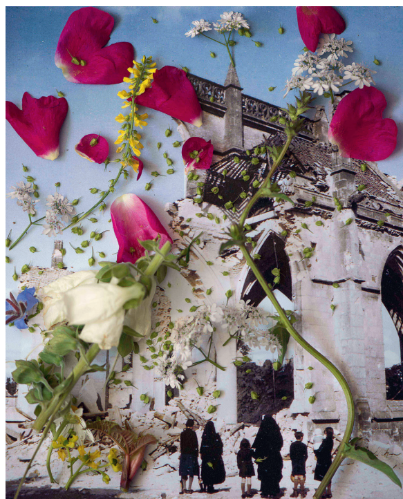
Laurence Aëgerter, Digitalis ambigua i.a., Normandy France , uit de serie Healing Plants for Hurt Landscapes , 2015, ultrachrome print, 110x89cm, edition 5 + 2 AP.

Het gevolg was nu dat kunstenaars en masse werden ondersteund als deze kwamen met originele oplossingen om zich financieel staande te houden. Velen van hen maakten corona edities voor bedragen rond de 100 à 150 euro die allemaal uitverkochten. Zo kwam de bekende Nederlandse